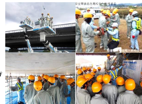
📷 延岡大橋現場見学会の様子