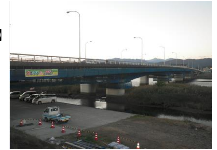
📷 吊足場設置の様子(12月頃)